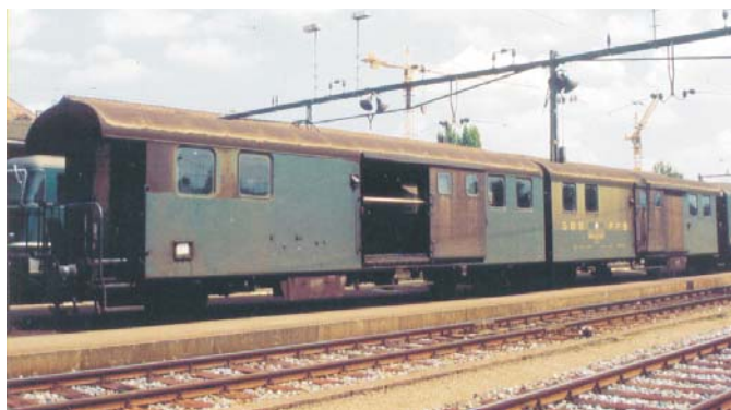
31718 new 05-2009 SBB Sortierwagen D2-D2 50 85 93-33 000-034. Baujahr 1962-1963. Zweiteilige Einheit kurzgekuppelt. Glattes Dach, ohne Fenstergitter. Epoche IV.