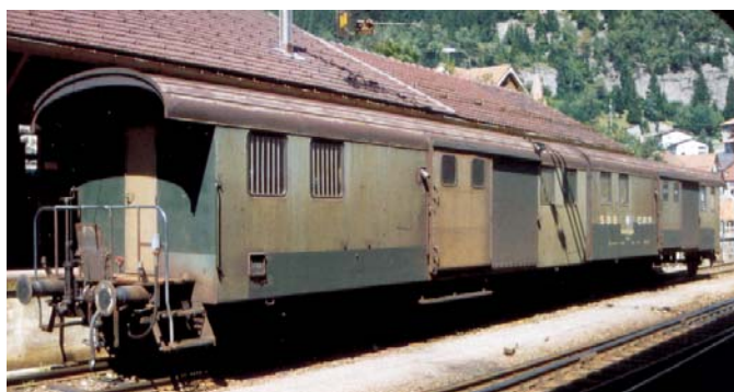
31716 new 03-2009 SBB Sortierwagen D2-D2 50 85 93-33 000-034. Baujahr 1962-1963. Zweiteilige Einheit kurzgekuppelt. Geripptes Dach, Fenstergitter. Stirntüre alu. Epoche IV.