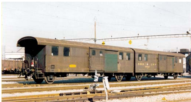
31715 new 03-2009 SBB Sortierwagen D2-D2 50 85 93-33 000-034. Baujahr 1962-1963. Zweiteilige Einheit kurzgekuppelt. Geripptes Dach, ohne Fenstergitter. Epoche IV.