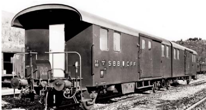
31717 new 05-2009 SBB Sortierwagen D2-D2 50 85 93-33 000-034. Baujahr 1962-1963. Zweiteilige Einheit kurzgekuppelt. Glattes Dach, Fenstergitter. Dach und Stirntüre alu. Epoche III.