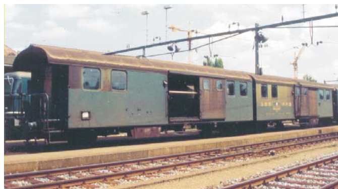
31717 new 05-2009 SBB Sortierwagen D2-D2 50 85 93-33 000-034. Baujahr 1962-1963. Zweiteilige Einheit kurzgekuppelt. Glattes Dach, Fenstergitter. Dach und Stirntüre alu. Epoche III.