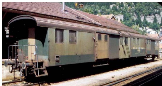
31715 new 03-2009 SBB Sortierwagen D2-D2 50 85 93-33 000-034. Baujahr 1962-1963. Zweiteilige Einheit kurzgekuppelt. Geripptes Dach, ohne Fenstergitter. Epoche IV.