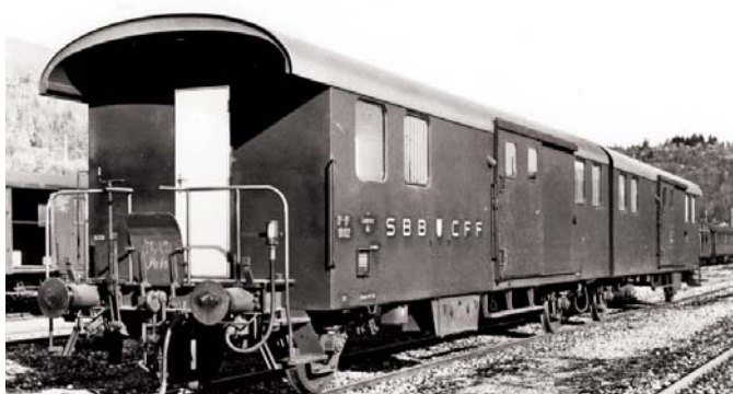
31716 new 03-2009 SBB Sortierwagen D2-D2 50 85 93-33 000-034. Baujahr 1962-1963. Zweiteilige Einheit kurzgekuppelt. Geripptes Dach, Fenstergitter. Stirntüre alu. Epoche IV.